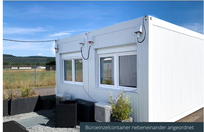
Büroeinzelcontainer nebeneinander angeordnet

Gewicht: 3.000 kg Zustand: Neuwertig Außenfarbe: RAL 7035 Lichtgrau