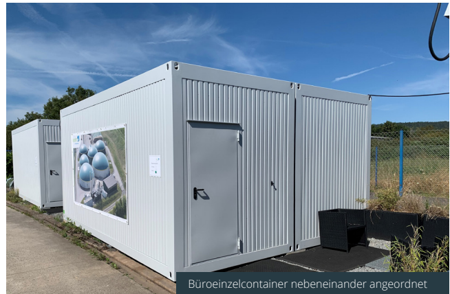
Büroeinzelcontainer nebeneinander angeordnet